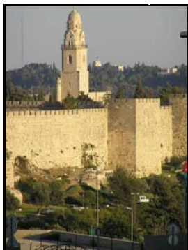
מיגדל דוד בירושלים