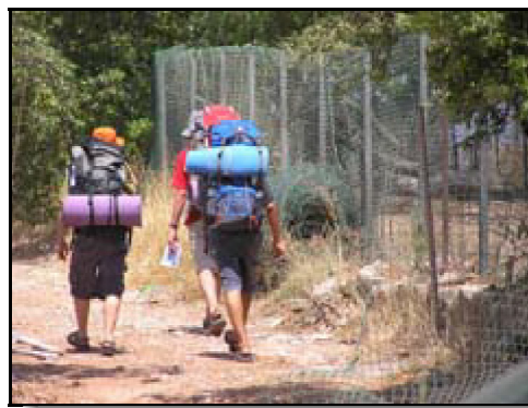
מה יש להם על הגב?