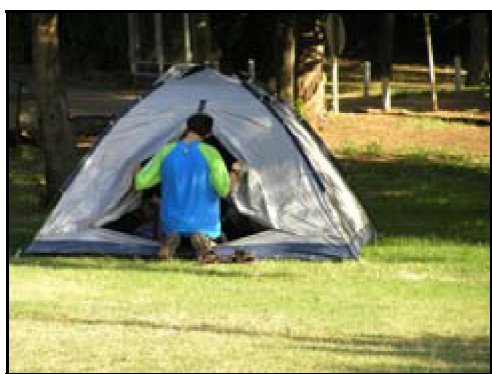
מה הוא מחפש באוהל?