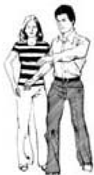
אמא ואבא הפירו בארץ

בוסטון היא עיר גדולה וחשובה בארצות הברית (USA).