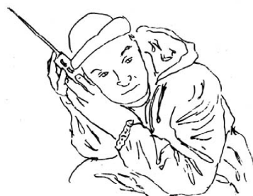
הוא מקשיב לרדיו

בעיתון, אמר להם את הערך המיספרי של הישוב, וכך הם תמיד ידעו לאן * ללכת. הכלבים עברו בין ישראל ללבנון, בין ישראל לסוריה, בין ישראל לירדן ובין ישראל למצרים. ישראל הייתה המרכז.